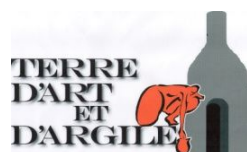
Figure majeure de la céramique actuelle, découvreur du raku, Camille Viot a joué un rôle de « passeur » tout à fait essentiel dans l'histoire de la céramique contemporaine.

Camille Viot associe divers matériaux à la terre: émaux, pâte de verre, béton vitreux( granulats et verre) bétons réfractaires, résidus, métal aluminium ou bronze, avec leurs techniques spécifiques de mises en œuvre, coffrage, moulage, coulage...etc, selon les objets céramiques ils peuvent alors subir jusqu'à 6 à 8 cuisson, de 1000° à 1250°.